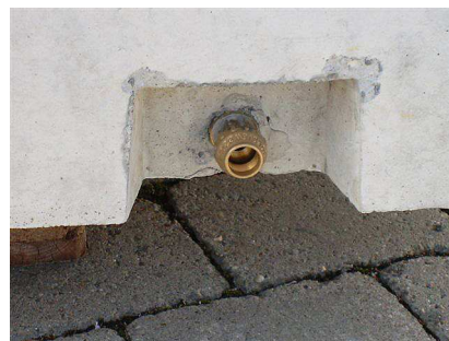
optional mit Spülanschluss